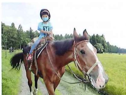
幼児も1人で馬に乗ります!